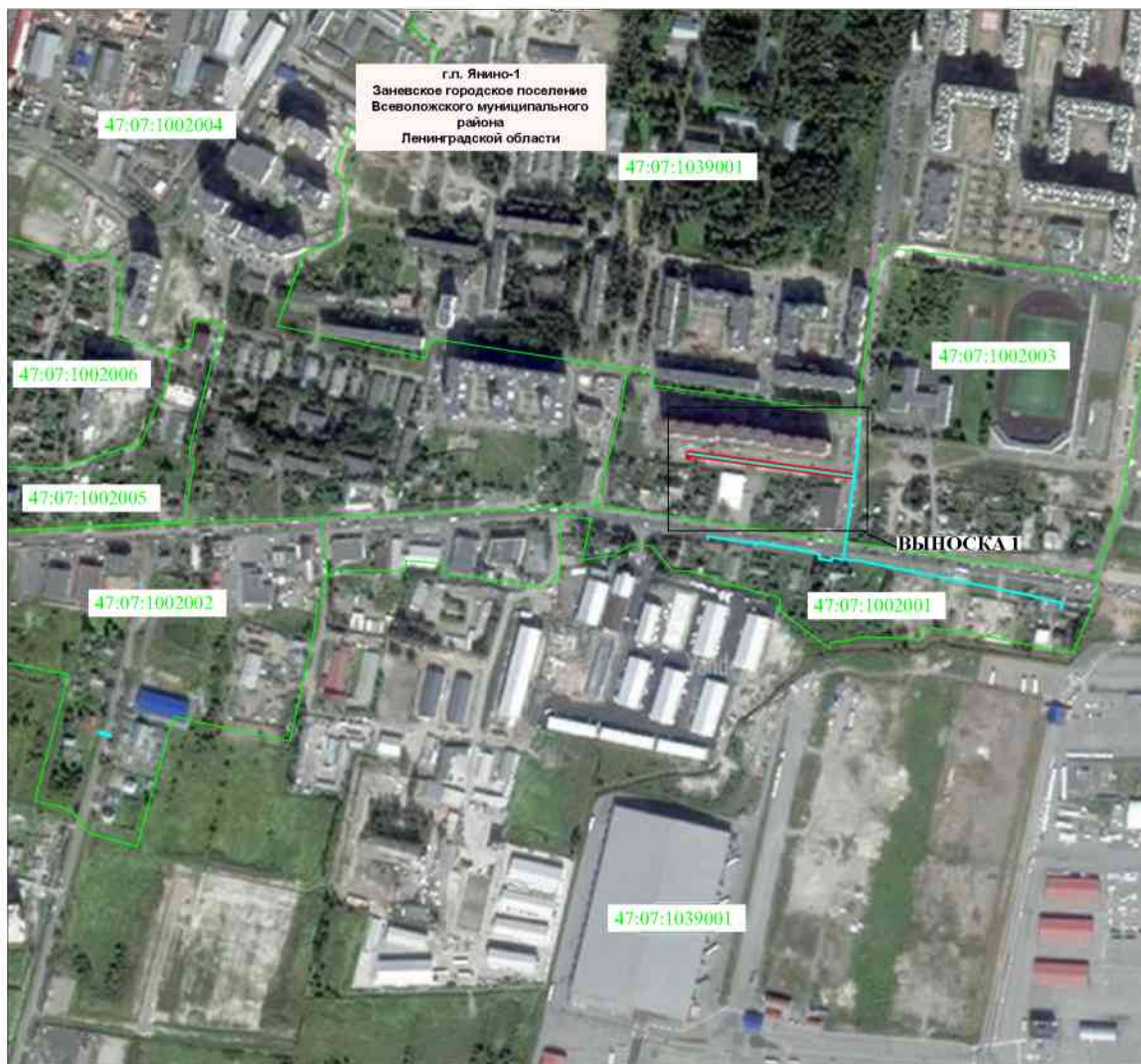
Схема расположения границ публичного сервитута Линейный объект: "Распределительный газопровод и газопроводы-вводы по г.п. Янино-1" Местоположение: Ленинградская область, Всеволожский муниципальный район, Заневское городское поселение, гп Янино-1 Кадастровый номер земельного участка в отношении которого испрашивается публичный сервитут: 47:07:1002003:23 Зона с ОУ1 S= 755 кв.м. в границах ЗУ с кн 47:07:1002003:23