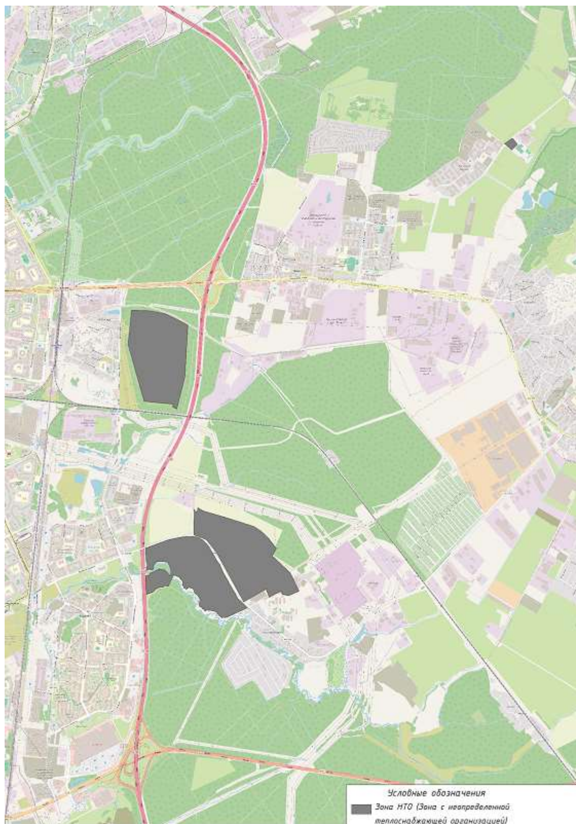
Рисунок 2. Образующие зоны с неопределенной теплоснабжающей организацией на территории Заневского городского поселения

территорий, определение зон ЕТО будет выполнено при последующих актуализациях схемы теплоснабжения.